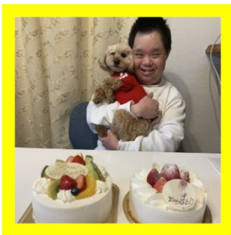
一緒に誕生日のお祝い