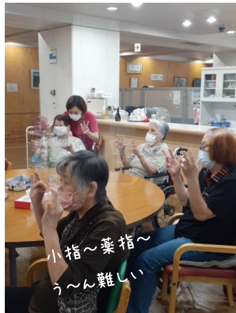
音楽に合わせて指の運動