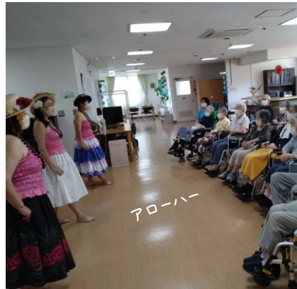
ハワイアンダンス