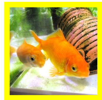
ぴーちゃんKOBEのアイドル