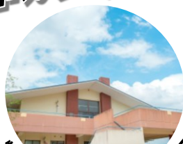
特別養護老人ホーム 透鹿園