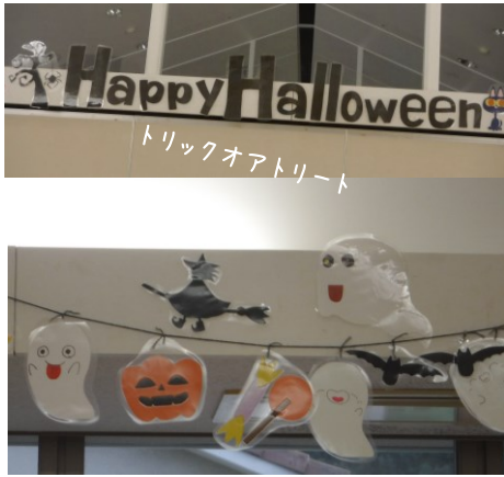
秋といえばハロウィン♪